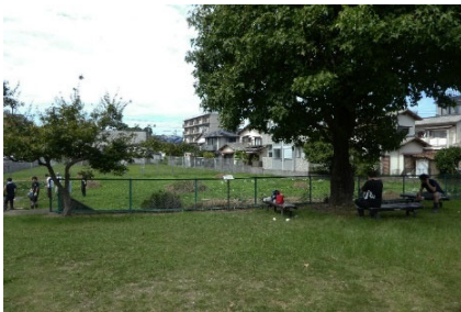
写真-1 遊休地のベンチと既存のカエデ

整備前の上記遊休地は中央部に高さ約15mのカエデがあり、すぐそばにベンチが設置されていたものの、損傷の激しい状態であった(写真-1)。また遊休地内に約1.5mの段差があり、フェンスによって敷地が二分されていた(写真-2)。上記畑は段差下の雑草地に隣接し、敷地内の往来は幅約1mの斜路付階段を通行する以外なく、畑への見通しやアクセスの悪さが指摘されていた(写真-3)。また雑草地全体にわたり水はけが悪く、畑作業や保育園児を招いた芋ほり大会以外、ほとんど人が立ち入らない空間と化していた。2020年6月の整備ではデイケア棟側に約2000m 2 の広場、その隣に約800m 2 の駐車場が新設され、上記段差をなくすことでフェンスを除去し、芝生の張られた緩やかな傾斜とS字を描く曲線的通路が設置された(写真-4)。また通路付近に新設されたベンチの後方には木陰を創出するための高さ約2.5mのシマトネリコが新植されている(写真-5)。さらに以前から広場中央にあったカエデの木から降りた辺りに幅2~6m程の畑が5箇所設けられ、隣接して水道やベンチも配置された(写真-6)。これらにより遊休地内の一体性と開放感が高まり、利用しやすい広場への整備が図られた。