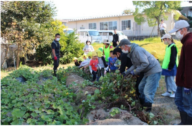
写真-13 メンバーと保育園児の芋ほりの様子