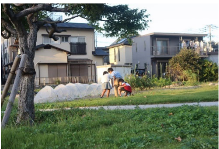
写真-10 畑そばで虫を探す子ども