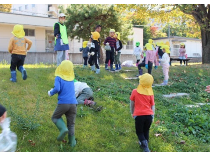
写真-11 斜面を駆け上がる子ども