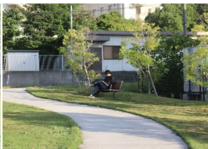
写真-8 園路そばのベンチで勉強する学生