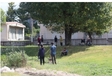
写真-7 アグリ活動中に休憩する様子