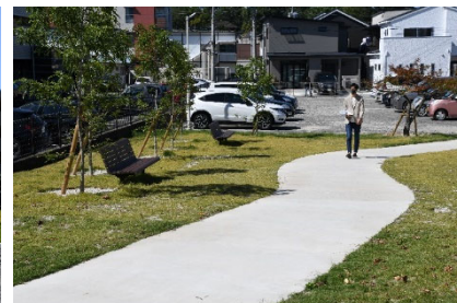
写真-5 新植された樹木とS字の通路