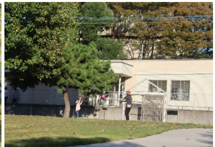
写真-9 平面部でボール遊びする親子