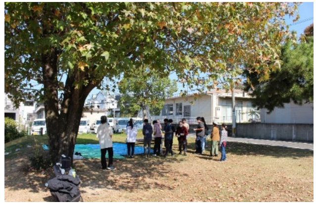
写真-14 カエデの木陰で行われるイベント

整備3年後のメンバーへのヒアリングから、木陰のあるベンチや広場内の自然に対する評価がみられたうえ、メンバー同士のコミュニケーションの場として広場および畑が機能していることが確認された。さらに職員へのヒアリングより、社会復帰に向け外に出ることが第一歩のメンバーの存在や屋内から出ていく場の一つとして広場があげられていた。他方、利用行動調査ではメンバーおよび利用者が木陰やベンチで休憩する様子や広場内の自然や緩傾斜を活用した子どもの遊びがみられた。利用者からもデイケア前広場における虫や植物等の自然に加え、安全に子どもを遊ばせられる場として評価され、カエデが広場のシンボルとして捉えられていることも看取された。さらに職員と周辺住民から「園路がデイケアと地域をつなげている」旨の回答があり、通り抜けられる園路の配置が広場内への動線を促し、広場自体の評価や近づきやすさに貢献していた。以上より、アグリ活動だ