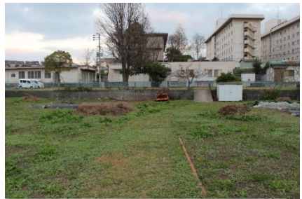
写真-3 斜路付き階段と畑の様子