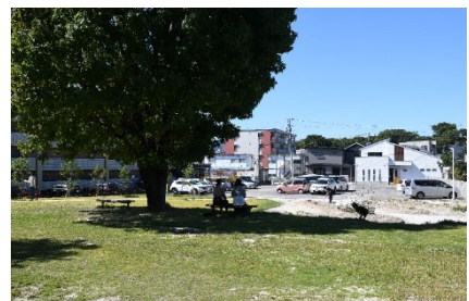
写真-6 既存樹下の新設されたベンチと畑