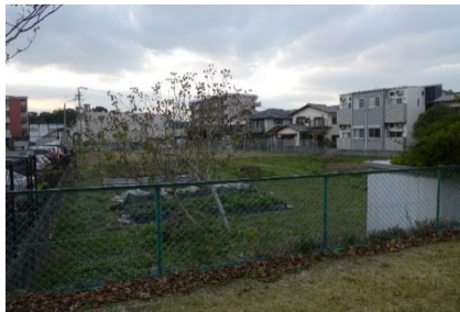
写真-2 遊休地のフェンスと畑の様子