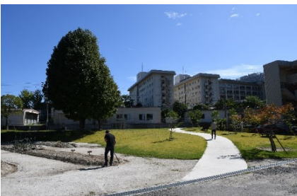
写真-4 整備後の広場と畑の様子