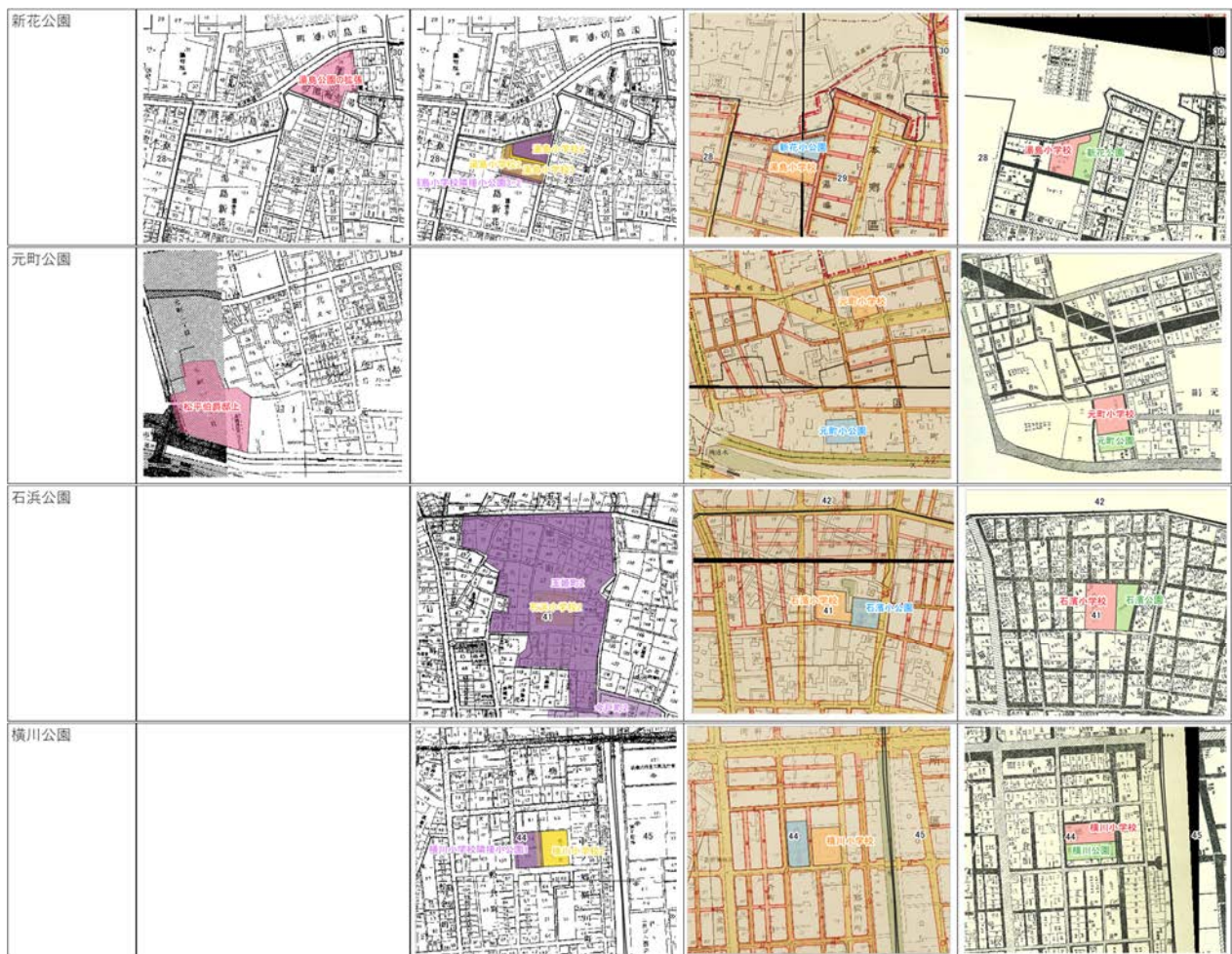
図-3 計画位置の復元（例）

注3) 東京大学工学部図書館所蔵。復興局土木部橋梁課（1924年）、「大東京三千分一地図 区画整理明細地図」、三千分一地形圖第貳拾七號六、明報堂。