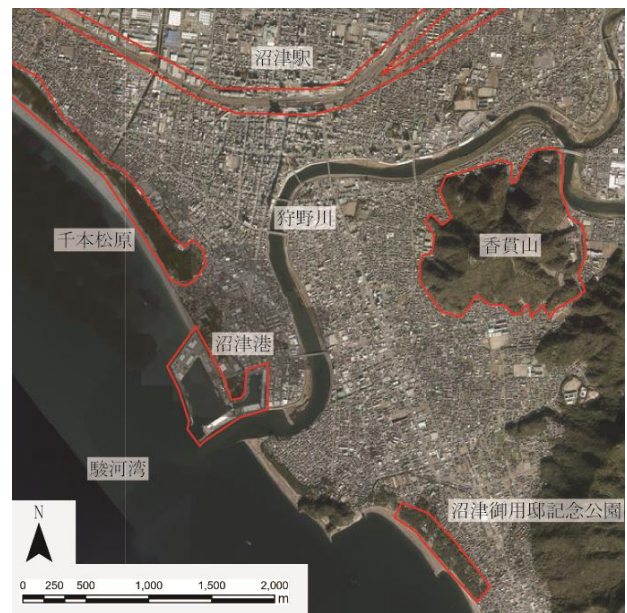
図-1 沼津市中心市街地の空間的特徴と地域資源