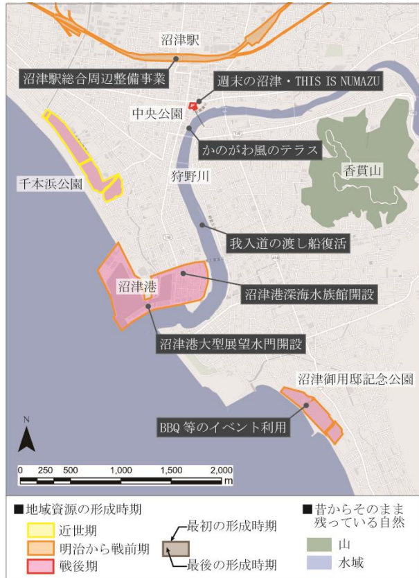
図-2 沼津市中心市街地における現代の空間的特徴

回答者属性を把握するため、この他に、性別、年齢、居住歴についても問う項目を設けた。以上の調査を行い、有効回答数15サンプルを得た。