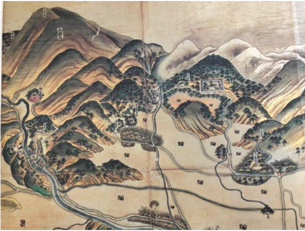
図5 古地図に見る修学院 (元禄十四年寶測大絵図(1701年)京都地図集成(柏書房))