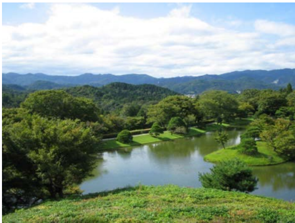
図3 視界の開放—浴龍池と洛北連山

そして、中御茶屋から上御茶屋へ移動した時に視界に大きな変化が生じる。隣雲亭に着き、土間庇の仕上げの朱色の一二三石に目が止まって、そこから眼下には裾野に切り開いた浴龍池のある庭園と刈込堰堤が見え、そして、背景には、修学院、松ヶ崎の連山、岩倉や貴船に至る奥の北山の連山、さらに、市街地を挟んで、愛宕山など西山の連山への視界が一举に遠望まで開放されることになる。ここでは雄大な盆地の景色が広がり、洛北の奥まで含む京都の三山が最も見える場所になる（図3参照）。窮邃亭からの眺めも同様に独特の山容への開放を体験することができる。