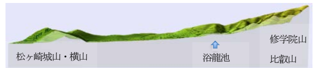
図4 修学院離宮の地形（国土地理院地図より）