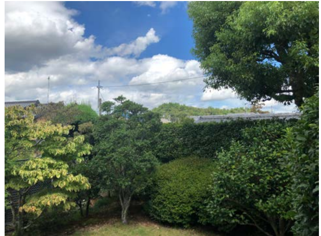
図7 個人の庭と修学院横山の借景