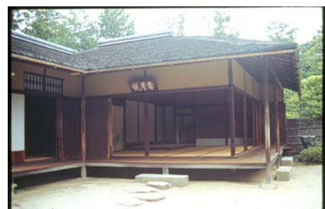
図2 御茶屋をつなぐ山道と寿月観