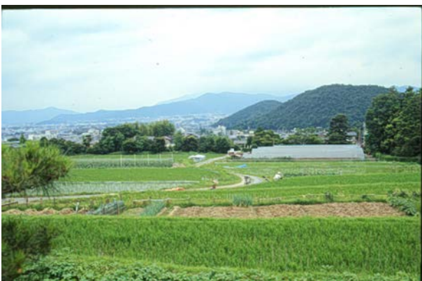
図6 修学院の風致一鷺の森と妙法山への眺め