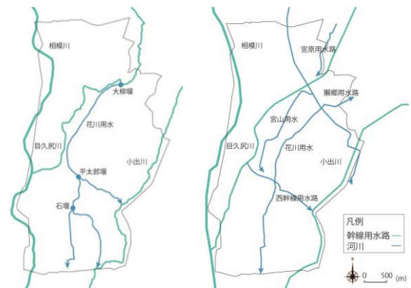
図-2 明治時代と現在の寒川町の用水路の変化