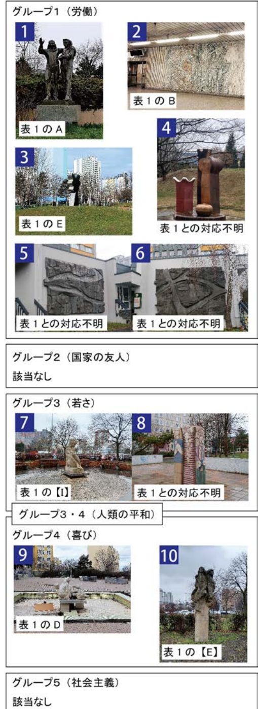
図-3 現存する造形芸術作品 (写真は全て筆者撮影, 2019)