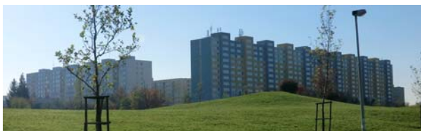
写真-1 プレハブパネル工法による集合住宅 (プラハ11区, 2013年)

チェコ共和国プラハ市プラハ11区には、社会主義時代に開発された、プレハブパネル工法による集合住宅(写真-1)の立ち並ぶ大規模住宅開発地 Jižní Město (South Townの意、以下JM)が存在する。社会主義時代の住宅開発地はこれまで、画一的である、灰色のイメージ、といった表現で語られることがあった一方で、その魅力については十分な関心が向けられてこなかった。しかし、このような住宅開発地は現在でも取り壊されることなく、住民の生活の場として一定の役割を果たしており、プラハ11区行政による地域再生に対する積極的な取り組みも行われている 1) 。以上の様な状況を踏まえ、JM住民は現在のJMの何を魅力として捉えているのかを明らかにするため、筆者は2015年に区の地域イベントの一環として、住民に地域で面白いと思う場所を書き込んでもらうガリバーマップ作成イベントを実施した 2) 。2015年のイベント結果を踏まえた上で、今回は更に、将来の地域再生に対する住民の意見を集める目的で、第2回ガリバーマップ作成イベントを実施した。