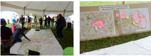
写真-2 (左) ガリバーマップを用いたワークショップの様子