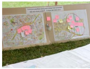
写真-3 (右) 注目エリアの拡大地図とコメント