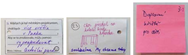
図-1 コメントカードの文章と記入されたカードの例 (左から表2の59, 表2の77, 表1の3-3に対応)

「もしも私が町のデザイナーだったなら、 (コメント1) がしたいです！ それを実現するために、私は (コメント2) ができます！」 場所：_____