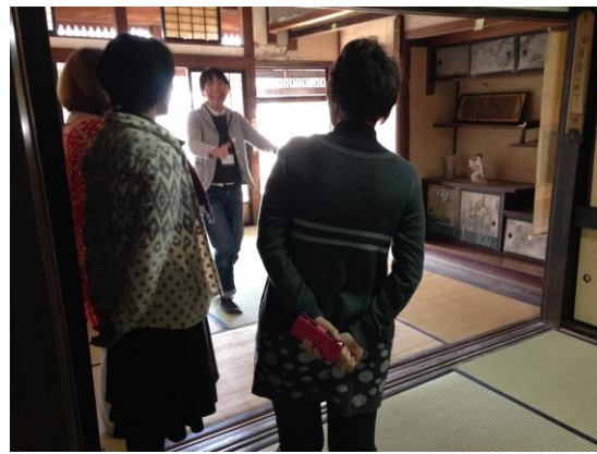
写真-5 古澤家内覧会の様子

10畳の和室は柳川暮らしつぐ会が、会の寄り合いや、会主催のイベントスペースとして使用しているほか、半