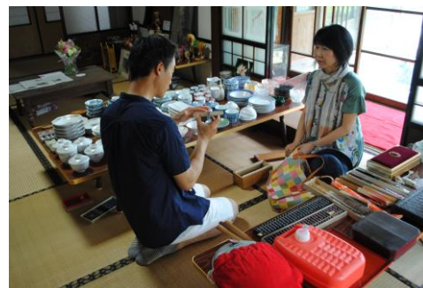
写真-8 帷子市での鯉節削り器の手入れ指南

の縁側は、通りと古民家をつなぐ和やかな境界となっている。縁側には季節の花々や、隣家から借りたさげもんが飾られ、彩り豊かなアプローチに誘われ、畳敷きの花屋へと赴く人も多い。通りすがりの若い夫婦は、結婚記念日に奥様が旦那様へのサプライズ花束を購入、小学生の常連客は、母の日には花束を抱えて家路へ…など、花を飾ったり、贈る機会が増えた住民もおり、暮らしに彩りが添えられているものと思われる。