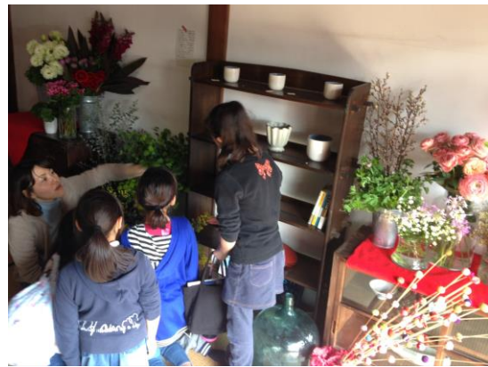
写真-6 花屋の小さな常連客

日単位のレンタルスペースとして、活用を図っている。寄り合いは月に1度程度行われ、会の運営状況の情報共有や主催イベントの企画・準備などが話し合われるほか、食卓を囲んだ会員同士の交流会も頻繁に行われている。会主催のイベントとしては、古澤家に遺る物品を次の使い手に継ぐ古物市である「帷子市(かたびらいち)」や、使わなくなった古い布団を座布団に蘇らせる「座布団ワークショップ」など、「継ぐ」にこだわった企画を展開している。