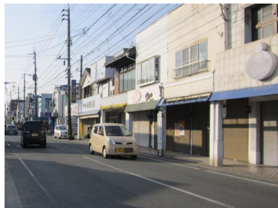
写真-2 現在の柳川商店街

こうした状況をふまえ、ワークショップの参加呼びかけは、地区住民への全戸回覧、区長への呼びかけ依頼に加え、当該地区で生まれ育った人や、当該地区やまちなみに興味を抱いている人などへと対象を拡げた。ワークショップ参加者は固定せず、口コミで参加者が増えることに期待して、適宜、出入り自由とした。