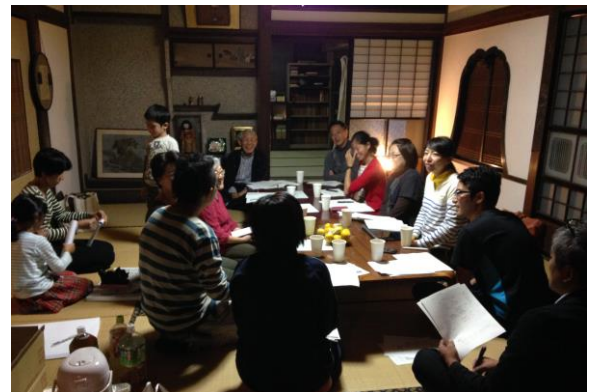
写真-1 柳川暮らしつぐ会の寄り合い

築100年を超える古民家「古澤家」は、会が最初に取り組んだ空家活用事例である。現在、通りに面した縁側を入口に畳敷きの座敷を利用して花屋が営まれ、周辺住民の暮らしに彩りを添えている。花等窓のある10畳の和室では月に1度の会の寄合いや、レンタルスペースを利用した習い事やイベント等が催されている(写真-1)。本稿は柳川暮らしつぐ会の設立の契機となった、まちなみワークショップの経緯を報告するとともに、柳川暮らしつぐ会の活動とそこで生まれている風景を紹介する。