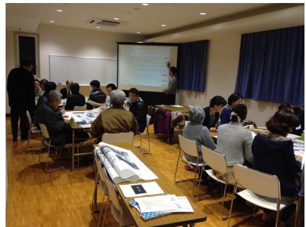
写真-3 参加者各自の取り組みテーマの選択(3グループ)

テーマ選択以後は、メンバー・内容を考慮して、ワークショップ参加者らが早急に取り組みたいとした2つのテーマ、「重点取り組みテーマⅠ；歩行者のための環境づくり」および「重点取り組みテーマⅡ；残したいものの