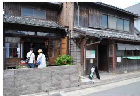
写真-7 花屋へ立ち寄る夫婦