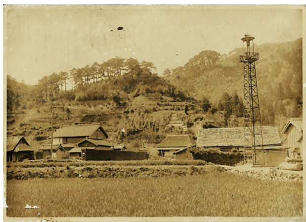
図-2 所有者の自宅とその周辺

風景に関連する写真は7枚で、庭の写真が4枚、集落の写真が2枚、夕日が1枚であった。この中でも集落の写真は、現在の風景との比較が可能であり、所有者の自宅とその周辺として撮影されていた(図-2)。この集落の写