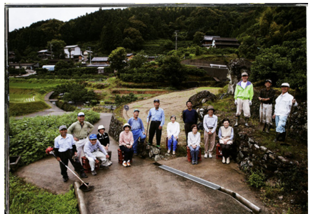
図-4 各常会別の集合写真(例)

表-2より、集合写真の撮影場所には、大きく分けて集落を背景とする場合、神社や集会所のように人が集まりやすくランドマークとしての機能を有する場合、潜水橋や石積みのように佐那河内村でも独自の要素を有する場合の3つがあることがわかった。いずれの場合においても、家や神社、山、田畑、橋、川など写真に写る要素は、各集落の構成要素として捉えることが可能である。また、それぞれの場合に対し、視点・視点場・視対象・対象場のいずれを重視して地域の特徴を表現しようとしている