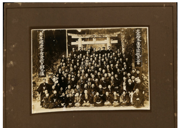
図-1 個人所有の写真(例)