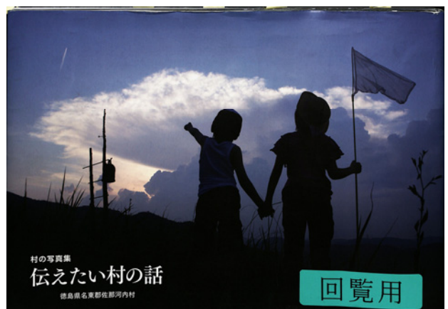
図-5 『村の写真集 伝えたい村の話』