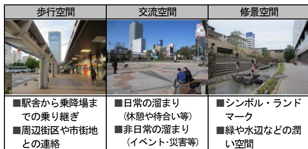
図-1 環境空間の空間構成と機能