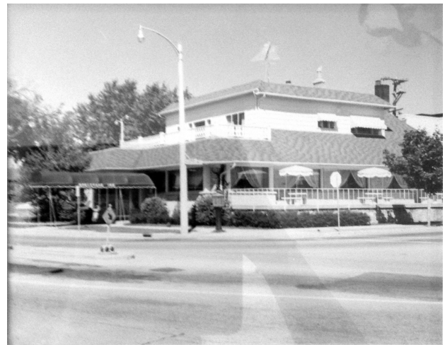
図-4 1970年代のパティオの様子。

本稿ではヴァナキュラー建築学における文脈という概念を通じて，時間的・空間的スケールの取り扱いに着目して議論を行った。そのため，北米を中心に発展した本分野と日本における諸分野（民俗学，生活学，建築・都市・景観史学）との関わりや，本分野と近隣分野（文化地理学，日常生活研究，歴史保全学，物質文化研究）との関わりについては本稿において詳しく議論していない。また，本稿はヴァナキュラー建築学の網羅的なレビューにはほど遠い