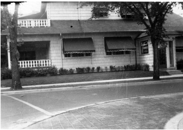
図-3 1940年代後半，購入時の物件の様子。左手に見えるのが後にふさがれるテラス。

どく問題になっていた時代であることがわかり，屋外飲食は一般的に好まれなかったことは理解できる。 15) また，主要な顧客らは店の西側に広がる郊外住宅地に住んでおり，この地域の住宅は開発年代（19世紀末～20世紀初頭）の流行を反映してそれ以前の住宅で一般的であった「ポーチ」という住宅前面の屋外飲食などが可能な空間をもたない傾向にあった。かわりに道路からのセットバックを大きくとり，芝生の前庭をもつものが圧倒的に多く，このような住宅で暮らす郊外住民がテラス・ポーチ・パティオなどで飲食を慣習的に好まなかった可能性は高い。 16)