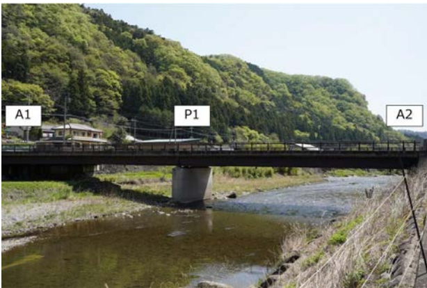
写真-3 A橋の全景：側面