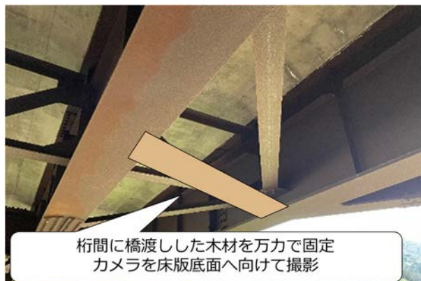
図-2 A橋のRC床版撮影用カメラの設置方法

置にカメラモジュールを設置・固定する。積層ゴム支承およびゴム支承近傍の鋼桁へのひずみゲージ設置は、橋台から作業可能であるため、専門業者ではなく著者らが設置作業を行う予定である。