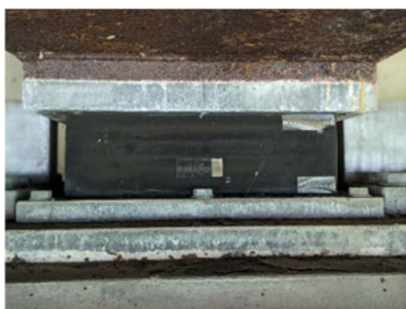
写真5 A橋のA1側G3桁の積層ゴム支承の状況