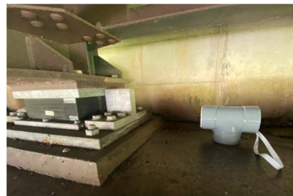
写真-6 A橋のA1側G3桁の撮影方法