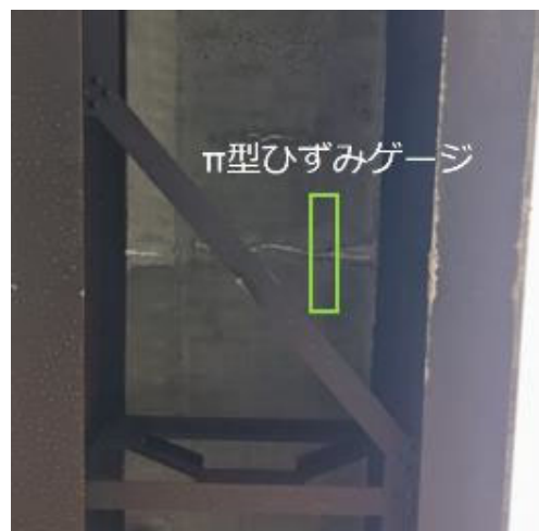
写真-4 A橋のRC床版下面の状況

A1橋台側のG3桁のゴム支承を写真-5に示す。外観では、オゾンや紫外線劣化による表面ひび割れもなく、残留ひずみも少なく、良好な状態である。本研究では、このゴム支承を対象にカメラモジュールを設置して、静止画像および動画をモニタリングで記録することにした。なお、ゴム支承には変位量が確認できるように、メジャーおよび蓄光テープを貼付した。温度変化に追従して変位しているか、仮に地震動を受けた場合、どの程度せん断変形したかを簡易的に記録するためである。