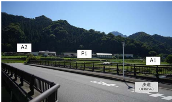
写真-2 A橋の全景：橋面