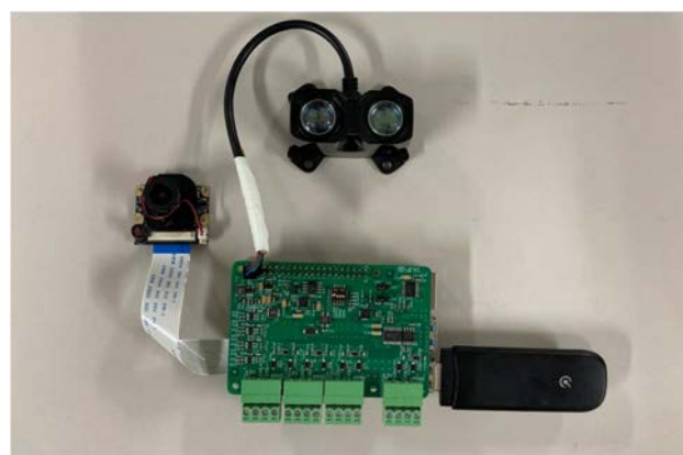
写真-1 IoT センサの構成例

実橋を対象とした IoT センサは屋外で活用するため、大雨や強風、猛暑など天候や鳥などの動物に対して、堅牢なケースが必要となる。その一方で、Raspberry Pi から発熱される熱の排熱や湿気対策もケースに施す必要がある。IoT センサの構成例として、Raspberry Pi 4 に距離センサ (LiDAR)、カメラモジュール、AD 変換器、通信用 USB ドングルを接続したセンサー一式を写真-1 に示す。写真-1 には掲載していないが、AD 変換器はブレッドボード等を介してひずみゲージを接続することができる。