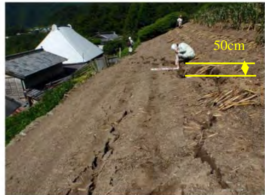
写真2 ブロック頭部の状況