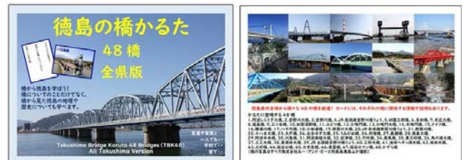
(a) 外箱表面と内箱底面のデザイン

かるたのフチなどの色は、徳島県特産の阿波藍を意識して藍色をベースとした。かるたに使用した橋の写真は、すべて協力企業と筆者が撮影したものである。