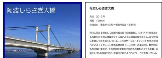
(b) 絵札表面と絵札裏面(説明文)の1例