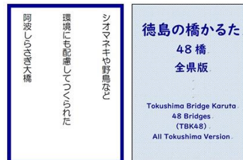
(c) 読札表面の1例と読札裏面