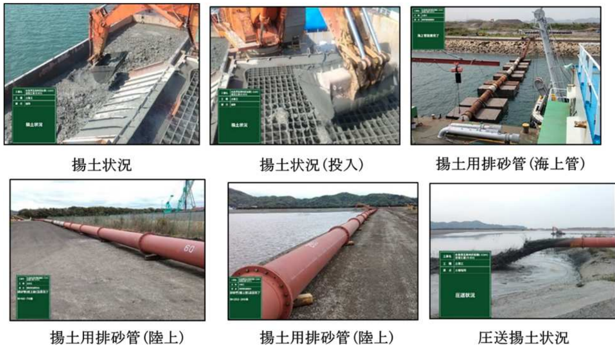
図-2 従来の揚土・埋め立て工の概要