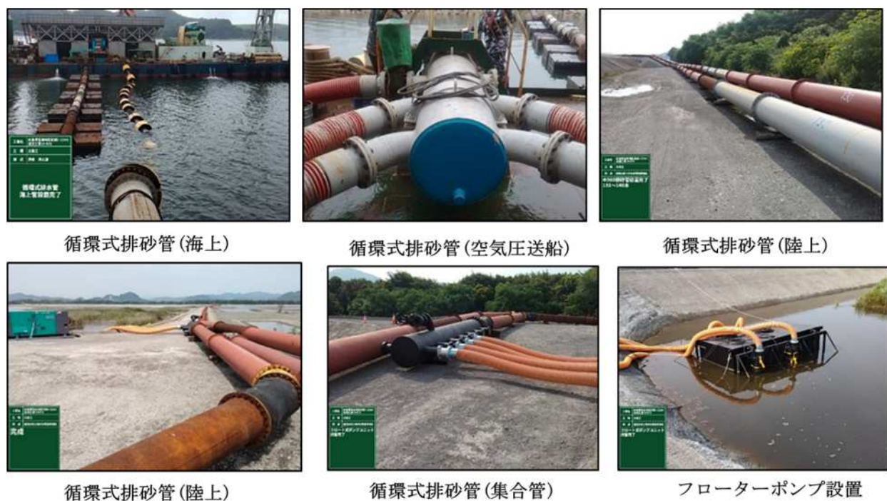
図-2 循環式排砂管を用いた揚土・埋め立て工の概要