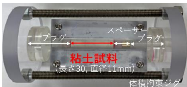
図-1 粘土供試体を含む試験セル

試験容器を図-1に示す。この容器はポリカーボネートとアルミニウム板を積層して接着した、厚板に、直径11mmの穴をあけて作成したもので、その内部に約30mmの粘土試料を圧縮して封入する構造になっている。モ