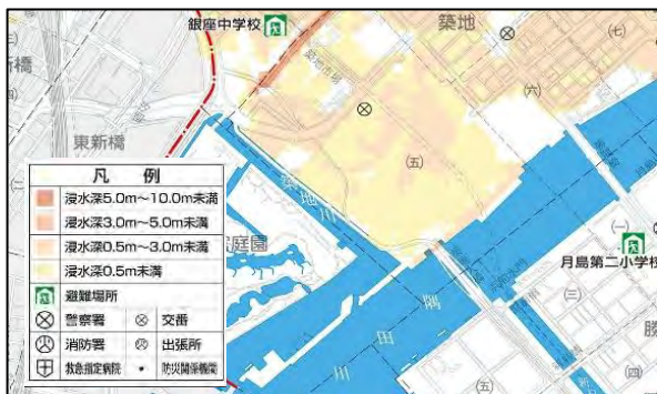
図-2 中央区洪水ハザードマップ(荒川版) (平成 31 年 3 月作成)

基礎調査等により、対象地域の現状、課題を把握し、ガイドライン検討のための基礎的な資料とした。