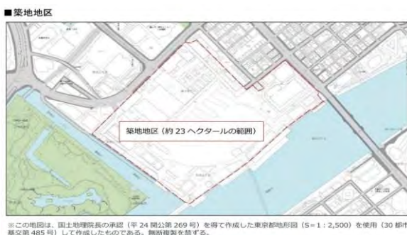
図-4 対象区域 (「築地まちづくり方針」(平成 31 年 3 月)より)

このうち荒川の洪水に関するものを図-2 に、高潮による浸水に関するものを図-3 に示す。