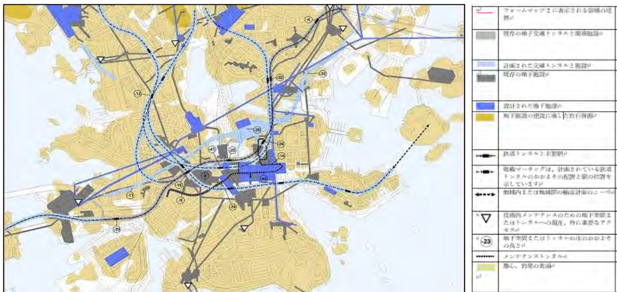
図-1 ヘルシンキの地下利用マスタープラン

本手引き(案)は、地下利用ガイドラインが地上と地下一体となって計画される基本的方向性を示すこ