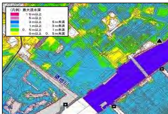
図-3 高潮浸水想定区域図(東京都港湾局 浸水深さ) (令和 2 年 7 月作成)