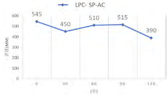
図-1 スランプフロー試験の結果

図-1 にスランプフロー試験の結果を示す。練り混ぜ直後のスランプフロー値は、施工性を高めた LPC-SP-AC が 545mm となり、練り混ぜから 2 時間後のスランプフロー値は 390mm とスランプロスが小さいことから十分な流動性を確保できると考えた。なお、OPC のスランプは 16cm であった。