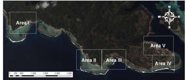
図-2 ギゾ島南部での調査領域設定(Area I～V)

造物被害が生じた。今回対象としたギゾ島は震源の位置から北西に位置し(図-1)，特に島の南部で大きな被害が見られた。今回の研究では島南部にArea IからArea Vまで5つの調査領域を設定し(図-2)，各領域で目視判読と画像処理による解析を行った。