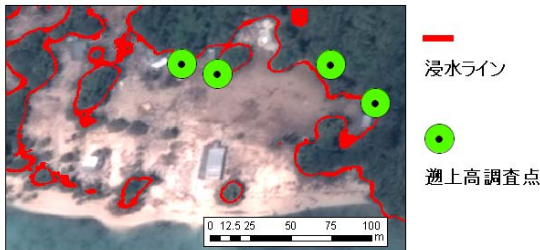
図-3 植生指標による浸水ラインの抽出（赤線）

表-2に各領域における浸水深と建造物の被害結果をまとめた．また図-4はArea II及びArea Vにおける結果を比