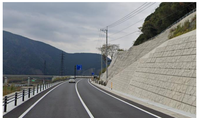
写真2 阿蘇地域・立野・国道57号線の一部の写真。 熊本地震による災害復興工事が行われた後の風景