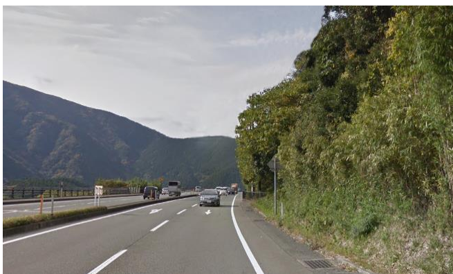
写真1 阿蘇地域・立野・国道57号線の一部の写真。 熊本地震前の風景

まずは自由記述回答文章からKJ法によりキーワードを抽出し、抽出されたキーワード群をグループ化し分類する。次に意味差異化法によって分類されたキーワードのなかから意味が対立するキーワードの組み合わせを一つの印象軸としてまとめた。そして、調査で用いた各写真