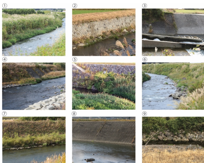
図-1 白川のアンケートパネル

以上の結果から、観光客にとって「阿蘇らしさ」とは緑が多く曲線的であることであり、コンクリートが用いられるか直線的であるものは、「阿蘇らしくない」ものとして目に映っていることが伺えた。被験者には、事前に阿蘇の歴史的・文化的な河川景観に関する情報を与えていないが、偶然にもそれらの河川景観と似通ったものが「阿蘇らしい」と感じる事が判明した。そしてこれは、現在熊本県が行っている災害復旧とは異なる方向、反対方向を向いたものである。