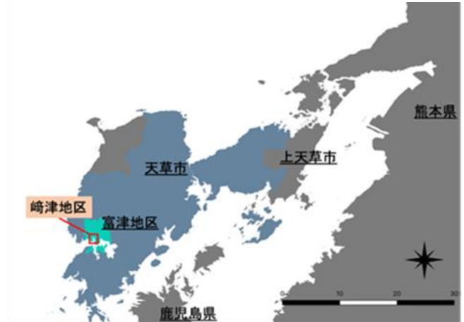
図-1 崎津地区の位置

崎津地区の漁業は明治期から昭和30年代までイワシ漁が盛んに行われていたが、乱獲などにより次第に衰えていった。羊角湾淡水化事業が昭和37年度に県計画に取り上げられ、昭和43年度に着工した。その後、崎津の漁業は羊角湾淡水化事業により海が濁り、現在では零細なものとなっている。