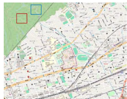
図 1 試験地位置図（赤：中尾谷，青：青谷）

本研究では、鳥居の手法 (3) と同様に、六甲山系南側斜面に位置する青谷試験地の表土層深実測データ（63 測点）を使用した。加えて、同じ六甲山系南側斜面に位置する中尾谷試験地において、簡易貫入試験を行い表土層深の実測データを得た（31 測点）（図 1 参照）。