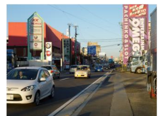
(写真 3) 国道 1 号