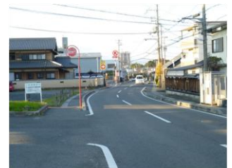
(写真 1) 野路東 4 丁目