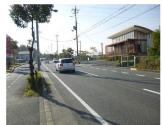
(写真 2) かがやき通り