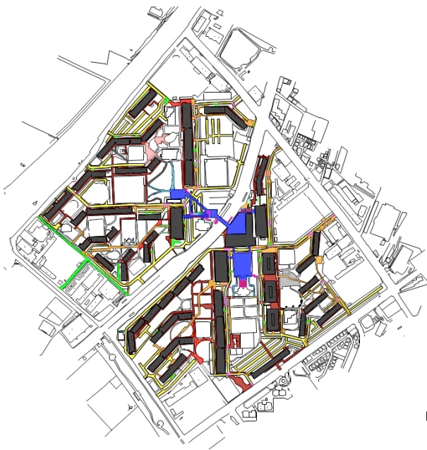
図2 対象地区データ