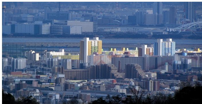
図1 武庫川団地全景(兵庫県西宮市)

本研究の対象地として、兵庫県西宮市の武庫川団地を選定した。対象地区は46haの大規模団地であるため多くの調査結果を得られる。また、団地再生に向けての取り組みをおこなっている最中であることから、研究に関する多くの情報を得られると同時に、成果が直接役に立つと考えた。