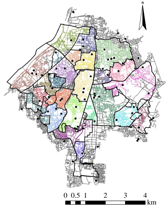
図-1 ネットワークボロノイ分割の結果

割を採用した。ボロノイ分割とは、任意の場所から直線距離で最も近い範囲に平面を分割したものであり、本研究で用いたネットワークボロノイ分割は、直線距離の代わりにネットワーク距離を用いて、基準となる点が最も近くなる範囲を求めたものである。対象領域内でのネットワークボロノイ分割に基づいた区分の結果を図-1に示す。図中の黒の道路線は、指定外の避難地のほうが近い道路線を表す。避難区域とネットワークボロノイ分割の結果は比較的一致しているものの、所々に黒色の道路線の表れていることが確認できる。ここでは、ネットワークボロノイ分割に基づいた道路長を「避難地が受け持つ道路長」とした上で、避難区域の道路総延長で除算したものを整合率とし、各避難区域で算出した。比較の対象として実施した直線距離での整合率はほとんどの避難区域で90%以上であったのに対して、ネットワーク距離での分析では半数以上の避難区域で90%を下回っていた。また、他市と隣接していない避難区域においても整合率が低い箇所もみられたほか、直線距離での整合率が低い値であった避難区域においてはネットワーク分析での整合率が10%前後高い値が得られたケースも確認できた。