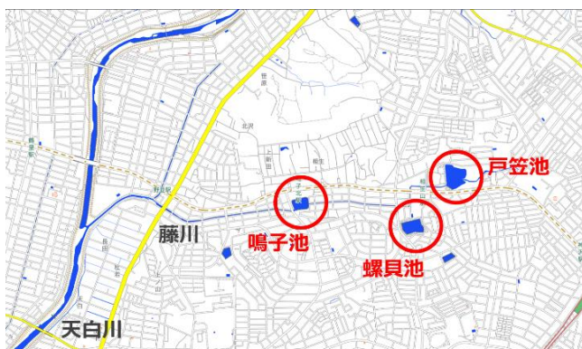
図1. 鳴子池と戸笠池と螺貝池

まず各ため池の流域を決定し、対象降雨を選定した後、各流域の1分ごとの平均降雨強度を求める。上流側ため池に当たる戸笠池と螺貝池の水位データから流入量及び流出量を算定し、流域特性を把握する。鳴子池についても同様の方法で流出特性を把握し、上流側ため池の貯留効果を考慮し