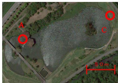
図1 調査地点(蓮沼海浜公園ボート)

千葉県山武市に位置する蓮沼海浜公園の水の広場にあるボート池は流入・流出が極端に少ない閉鎖的水域であり、例年アオコが発生し、景観の悪化、悪臭の発生などが問題となっている。1999年度より水質、プランクトン相の調査がされているが、ボート池の環境修復に活用することを目的として、2013年度より大型底生生物も含めた生態系構造の解析を進めている。また、ボート池では2015年1月～3月までパークゴルフ場の建設により池の埋め立て・海水の流入が行われた。本研究では、ボート池の底生生物炭素量による生態系構造の解析を目的とし、2016年度データとの比較により生態系への影響評価を行った。