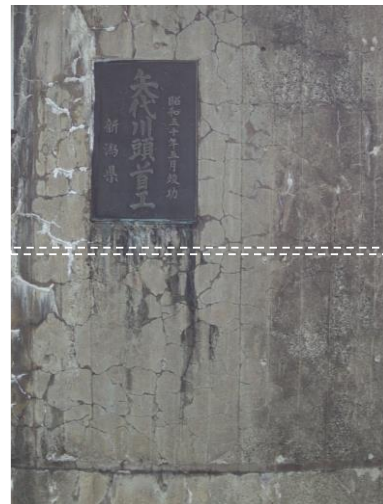
Fig.2 解析範囲 (左岸側堰柱部)