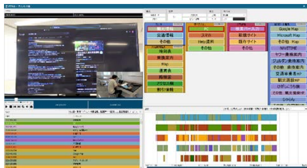
図2 実験の様子とコーディング作業画面

実験対象者の後ろ姿とPCの画面をビデオカメラで動画撮影し、データを取得した(図2)。情報探索実験終了後に、