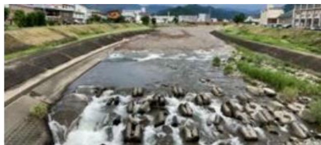
写真-1 段波が流下する様子 2) (佐梨川 (新潟県))