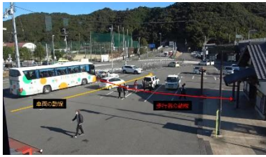
図-6 観光バス乗客と車両間での動線交錯事例