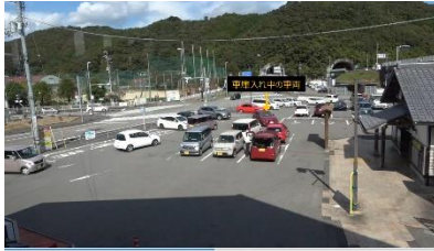
図-7 入出庫車両間での動線交錯事例