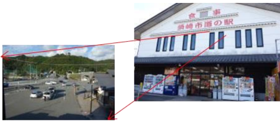
図-2 第一駐車場のビデオ撮影状況

国土交通省四国地方整備局土佐国道事務所と須崎市が共同管理する「道の駅かわうその里すさき」第一駐車場の通常利用状況を、動画記録した。撮影は、令和3年10月28日（金）7～10時と同10月29日（土）10～15時にビデオカメラ1台を用いて、建屋上階から第一駐車場を望むアングル（図-2）で実施した。撮影に先立ち、道路管理者および道の駅指定管理者と協議を行い、東京大学本部ライフサイエンス研究倫理支援室の指導に従い、ビデオ撮影中であることを来訪者に明示する貼り紙を場内数か所に掲げた。