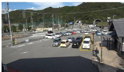
図-8 駐車ます以外への駐車事例