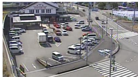
図-5 第一駐車場のCCTV画角

ビデオ撮影を補完する高所からの画角も望めることから、当該道の駅を管理する高知国道維持事務所のCCTV映像（図-5）も借用し、建屋からの観測データと併せて、歩車間・車車間の動線交錯シーンを抽出・集計した。