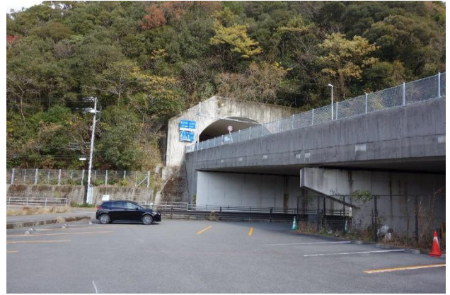
図-4 運転評価実験の光景