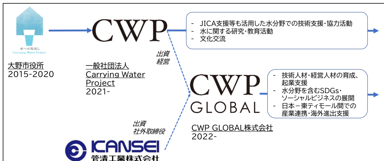
図-3 CWPの活動主体の変遷

地域活性化を目的とした自治体事業は、予算が終了すると継続が困難になる事例が多い。それに対して CWP は、予算が終了し、また市として継続の意向がなかったにも関わらず、有志が自主的に一社 CWP を結成し取組