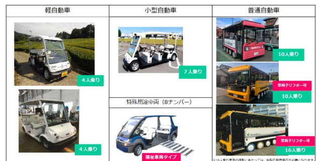
図-1 グリーンスローモビリティの分類

また、グリスロは、(イ) Green<CO2排出量が少ない電気自動車>、(ロ) Slow<ゆっくりした走行>、(ハ) Safety<低速な速度制限で高齢でも運転が可能>、(ニ) Small<郊外住宅市街地のような狭隘な生活道路も走行可能>、(ホ) Open<窓や仕切りが少なく開放的>という5つの特徴を備えており、乗車定員等により複数の種類が存在する（図-1） 8) 。