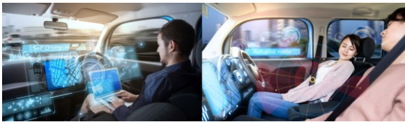
図-1 調査票に掲載した SAV 内の乗客の様子