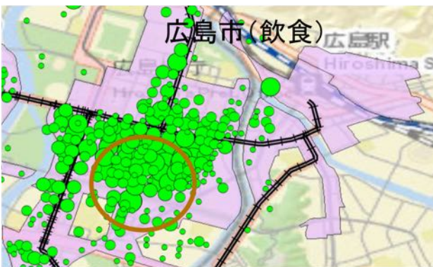
図- 5 交通施設から離れた地区に商業施設が分布