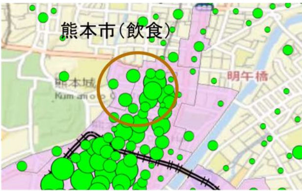
図- 3 地方鉄道駅・路線沿線に商業施設が分布