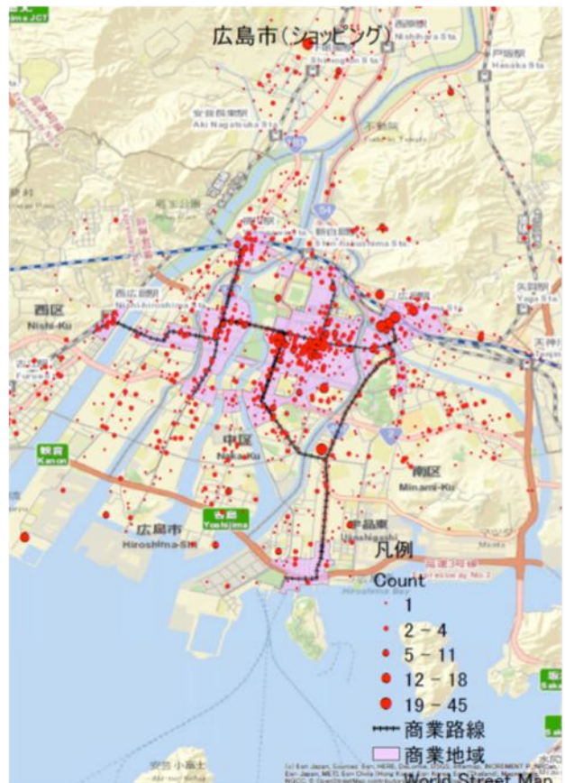
図- 1 商業施設の分布 (広島市、ショッピング)

表- 1に示した都市において、表- 3の業種別店舗の分布状況を地図上にプロットする。一例として、広島市のショッピング施設の分布状況を、「商業地域」、広島電鉄路線と共に図- 1に示す。施設は街区単位でプロットしているが、同じ街区にいくつの施設があるかを円の大ききで表示している。