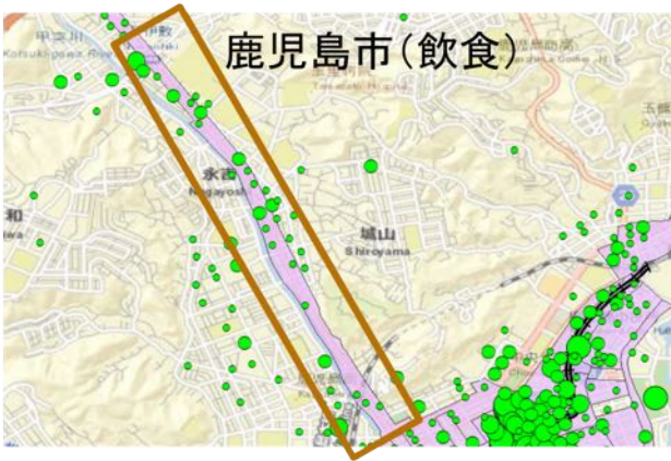
図- 4 幹線道路沿いに商業施設が分布