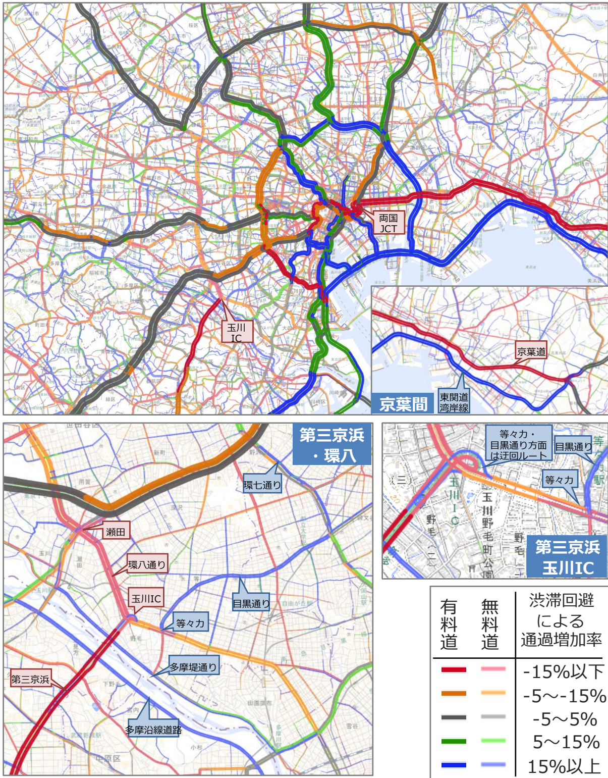
図4 首都圏道路ネットワークのプローブ渋滞予測による通過増減図