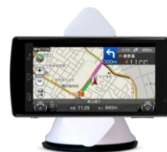
図 1 携帯カーナビ「カーナビタイム」

渋滞回避ルート案内は、基本的にはドライバー自身の所要時間短縮のための機能ではあるが、経路転換による交通円滑化にも寄与していると考えられる。しかしながら、その所要時間短縮効果や経路転換の実態については、特定日時・地点におけるケーススタディに留まっており、