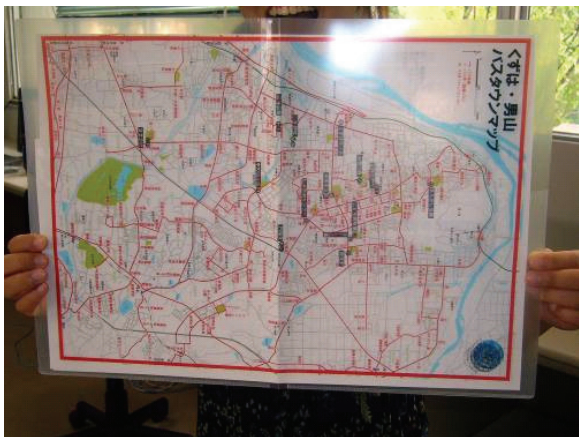
写真-1 バスタウンマップ

タウンマップを作製し、最初の情報シートでこの地域のユニークな公園、史跡を紹介した。この公園・史跡シートは、ポイントの簡単な説明と写真、もよりのバス停を含んだ地図、住民からのおすすめ理由などを示している。この地域は、枚方市だけではなく生活圏に枚方市楠葉地区が含まれる八幡市男山地区も含んでおり、行政区で区切るのではなく生活圏で区切ることで市はおろか府をこえた範囲の地図になっている点にもう一つの特徴がある。