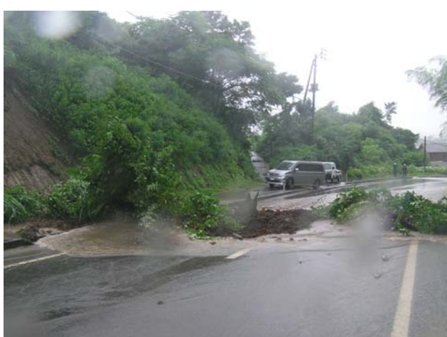
写真-4 豪雨による土砂崩れ

う緊急車両等がプローブカー情報を提供すれば、災害対応に必要な道路情報が得られる。災害時の道路情報は、平常時の渋滞情報等と異なり、精度よりも有ることが重要である。とくに緊急対応はほとんど情報がない中で行われている。精度が多少低くとも、必要とするのが災害情報である。