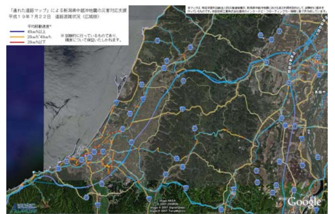
図-3 走行速度情報（Google Earth版）

センターに送られる。この処理の段階で、多点データは間引かれ、ある区間の走行速度を計算できる程度の線データに集約されている。したがって車載器側には多くの貴重な走行軌跡データがあるので、これを災害情報としてさらに活用できる可能性がある。また、車に各種センサーを組み込むことによって、さらに詳細な車の走行をセンシングすることも可能である。