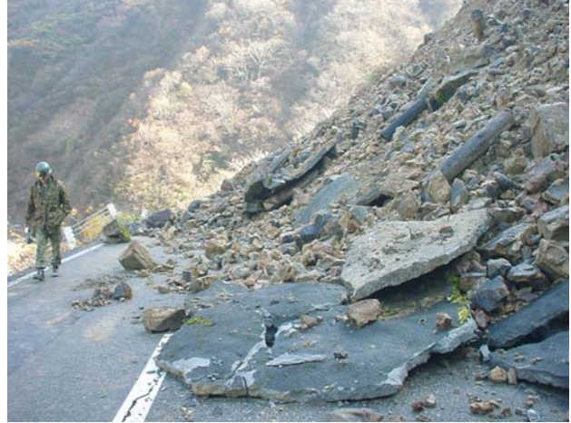
写真-2 がけ崩れによる道路閉塞