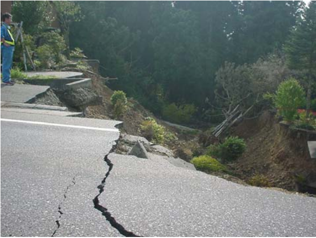
写真-1 盛土崩壊による道路途絶