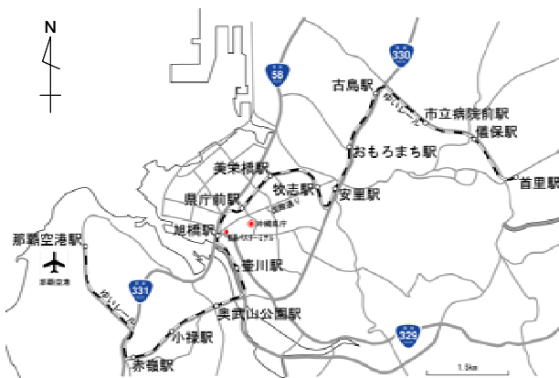
図-1 ゆいレールの路線

ゆいレールの路線を図-1に示す。ゆいレールは2003年8月10日に開業、那覇空港から那覇市中心部を經由し首里までに至る営業キロ12.9km、駅数15の跨座式モノレールで、沖縄県で戦後初の軌道系公共交通機関である。開業前の需要予測では2003年度31,350人/日とされた。開業直後の2003年8月における利用者数は夏の観光シーズンも重なり1日あたり46,600人を記録し、戦後初の軌道系公共交通機関に対する一般の注目の高さがうかがえる結果となったが、その後利用者数は低迷し、2004年は全体的に需要予測値を下回る形で推移した。しかし、徐々に利用者数は増加し2005年2月以降2006年3月現在までは全ての月で需要予測値を上回っている。