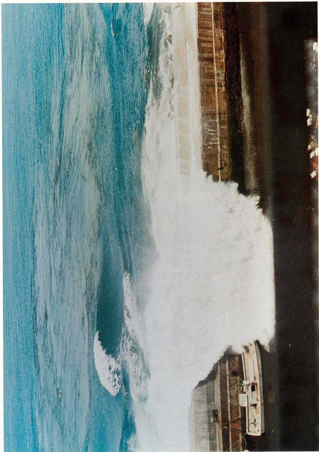
写真—1 秋田県鹿角市北浦の島漁港を襲う日本海中部地震津波第1波、昭和58年5月26日12時7-8分頃。