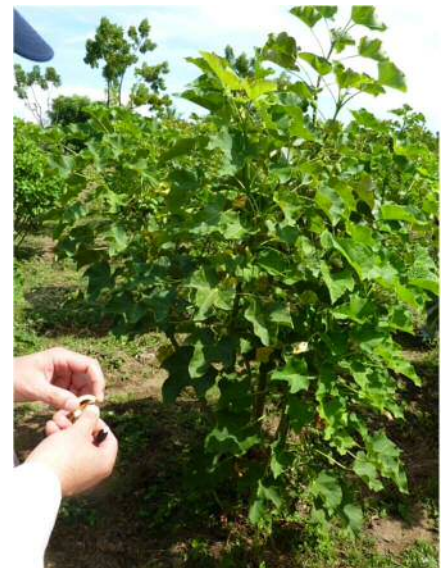
図4 ジャトロファ(本体)

重油相当)得られるとされている。生育・結実には、年平均気温が17~28℃程度必要とされている