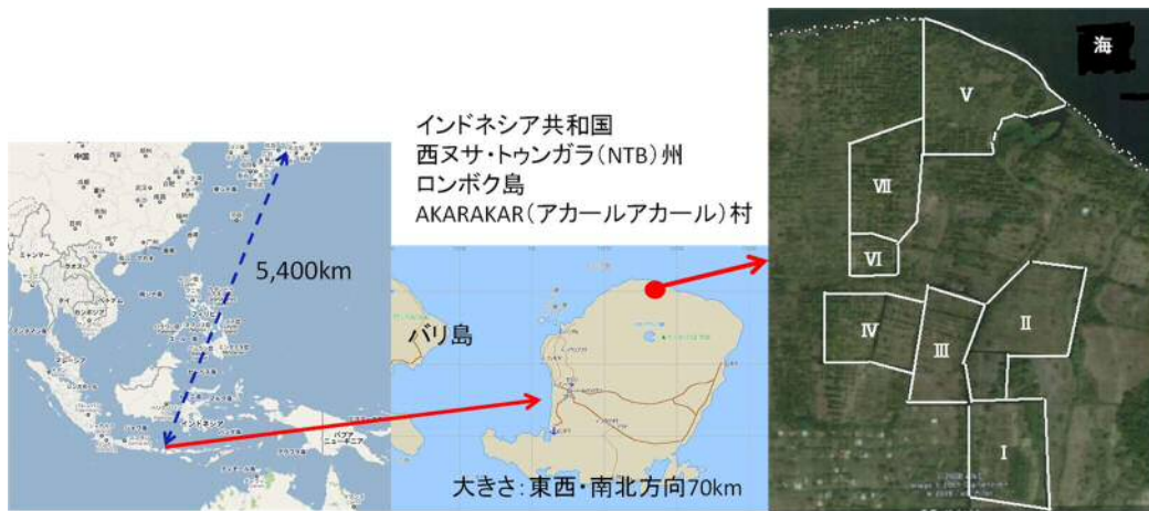
図1 栽培試験地(ロンボク島)

地球温暖化防止のための中心的な施策として原子力発電がその役割を担ってきたが、約10年前の東北地震によりその役割に変化が生じ、太陽光やバイオマス等の自然エネルギーに目が向けられてきた。また、原油価格の上昇によりエネルギー施策について再検討が行われてきた。その中で、資源植物(油糧作物)についても過去何度も検討されてきたが、油糧作物に関する知見が乏しいことから、明確な指針は示されてこなかった。そこで、様々な栽培条件下において油糧作物の代表としてジャトロファの基本的な性質を明らかにするため、インドネシアにおいて各種栽培試験を実施したので、ここに報告するものである。