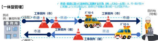
図1 包括委託におけるマルチタスクのイメージ

本実証実験では、ドライブレコーダーからデータを収集し、AI分析を行うことで道路の損傷箇所などを自動で検出する技術を活用することで、巡回、点検等が包括された場合に、日常管理の高度化、点検業務の効率化に資するか検討を行った。