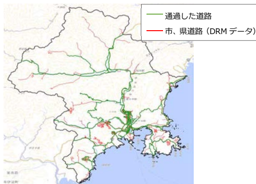
図 6 走行軌跡

巡回においては、データ取得することともに、どの箇所を走行したかという事実（網羅率）も重要である。DRM データと走行した箇所を比較した結果（図 6）、下田市内の道路（市、県含む）の 54%を網羅していた。県管理路線は網羅されており、県の巡回としては従前と同等以上のデータが得られる可能性は確認できた。