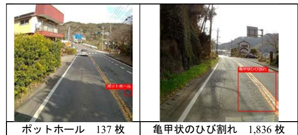
図3 取得されるデータの例

2021/12/20～2022/2/17において、実証実験車両（下田市、下田土木事務所、下田市内従来業務実績業者の車両）及び技術契約車両（本技術に契約しているすべての車両）のドライブレコーダーの画像より、4,808枚の損傷等のデータを保有していた（図3）。