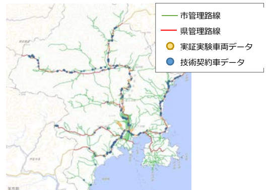
図 7 亀甲状・線状・横線状ひび割れの検知箇所

たフィルタリングは可能であるが、この閾値と実際の損傷程度の相関性が定量的に評価できておらず、状態を把握しているとは言いにくい結果となった。