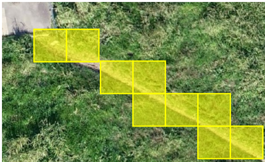
図1 classificationによる変状検出イメージ