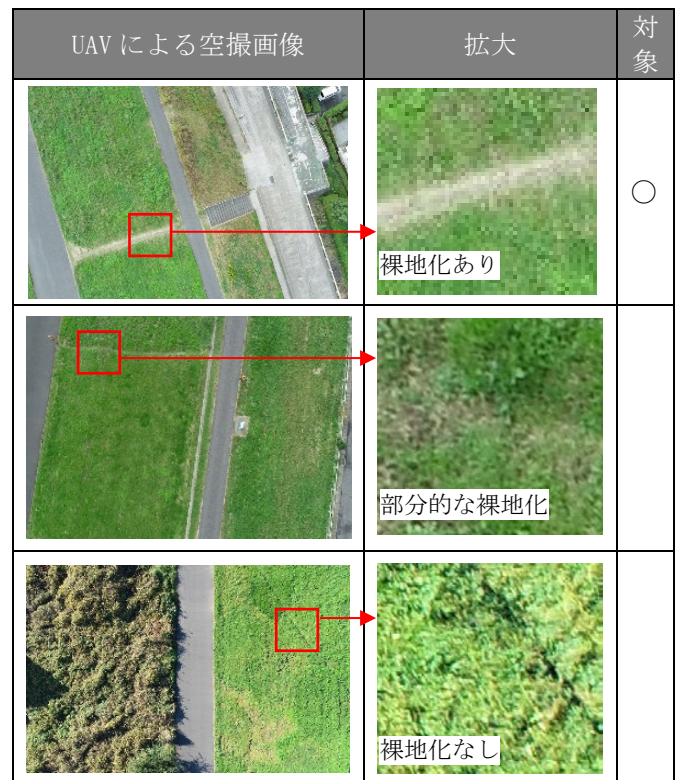
表3 解析の対象変状例

UAVによる空撮にあたってはPhantom4 Pro V2を用いて高度約40mより鉛直方向に撮影し、地表面の解像度は1cm/pixとした。