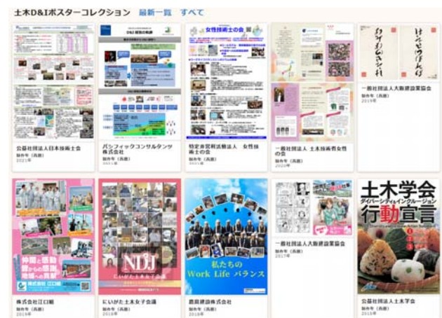
図-5 土木 D&I ポスターコレクション画面

具体的には、各職場等の D&I に関する取り組みを表現したものを公募し、応募のあったポスターを掲示するというもので、以前のポスター展では土木会館 1 階廊下壁面を利用して期間限定で掲載したが、今回のポスターコレクションではコロナ禍もあって常設展のような形でのウェブ掲載とした（図-5）。