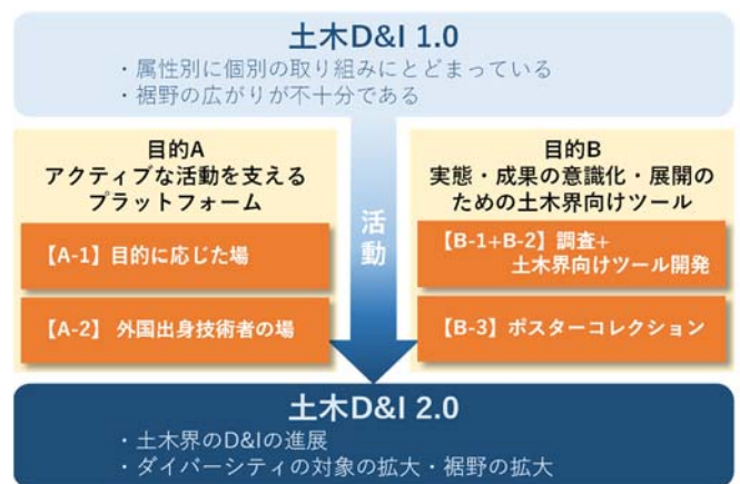
図-1 「土木D&amp;I2.0にむけた活動の場とツールをつくる」における目的と目標

もう一つは、自らの職場でD&Iの進捗状況や成果を意識化することにより、土木界のD&I進展をはかるための土木界向けツールを作成することである(図-1)。