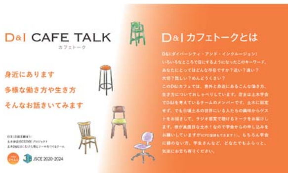
図-2 D&I カフェトークのコンセプト

カフェトークは、女性、男性、外国出身者、土木以外の業界の方など多様なゲストによる多様な話題で、開催回数は 2021 年度末までに 20 回を数え、全回アーカイブ映像を視聴できるようにしている（図-2）。