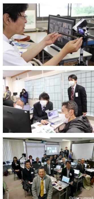
図-1 実務家教員育成研修プログラムの全体概要

キーワード 実務家教員，リカレント教育，高専，インフラメンテナンス，人材育成，技術継承