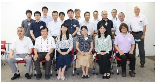
写真 1 第 1 期生集合写真

筆者ら 15 名は、「KOSEN 型産学共同インフラメンテナンス人材育成システムの構築」(KOSEN-REIM) が実施する『実務家教員育成研修プログラム』の第 1 期生として約 8 ヶ月間、実践的なカリキュラムを受講し、建設技術者として「教える技術」を修得した。