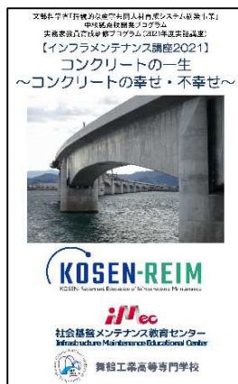
図 2 作成した教材

講習会テキストは、eラーニングとの繋がりおよび講義での使用、その後も活用できる教材にすることを意識して作成した。【講義 1】では、良いコンクリートをつくるために、学校の授業では教わらない生コンプラントにおけるコンクリート製造管理時の留意点が伝わる内容とした。【講義 2】では、近年の建造物の大型化により問題となっている温度ひび割れ対策などについて、写真や図を多く用い、視覚的に状況判断ができるものとした。【講義 3】では、劣化・損傷事例、原因究明、対策工法の施工事例の紹介において、水の排除などの重要な箇所に、eラーニングで使ったテキストと同じ内容のものをあえて使用し、知識の定着を図った。【講義 4】では、早期再劣化の現状と対策について、要点だけを簡潔に記載した部分をつくり、授業中に手を動かしてメモを取ることで集中力を持続させるように配慮した。(図 2)