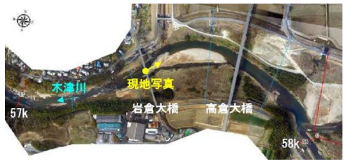
平成 31 年 2 月撮影

魚類の環境 DNA は、代表区間 7 箇所まで計 33 種を検出した。このうち、注目すべき生物は、アユ及びドンコの 2 種が確認された。一方、ドジョウ、アジメドジョウ、ミナミメダカ、ウツセミカジカ(琵琶湖型)の 4 種については、注目すべき生物に設定されているものの、環境 DNA を検出することはできなかった。