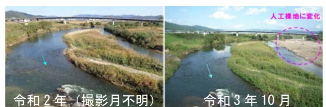
図-1 定点写真から見た経年比較

しかしながら、木津川上流の代表区間及び保全区間には、区間全体を撮影できる眺望点がなく、図-1のように定点写真撮影のみでは環境変化の範囲や規模を把握することは困難であった。また、代表区間の健全性を評価するために設定された注目すべき生物(魚類・植物・鳥類)についても、水位変動を考慮した上での生息場の評価は、専門性が高く見視のみでは困難であった。