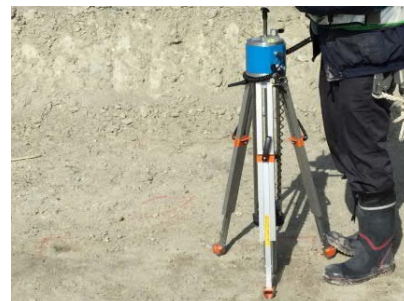
写真-1 キャスポル測定状況

粉塵抑制資材はAs 舗装の下層路盤である再生砕石舗装上で散布した。再生砕石舗装は、As 舗装前に路面整正で仕上げるため、粉塵抑制資材を散布したことによる下層路盤およびAs 舗装への強度に係る品質に関する影響が懸念された。品質の影響を評価するために、簡易支持力測定器「キャスポル(写真-1)」を使用し、資材散布前後の衝撃加速度を測定し、測定結果を基にしてCBR値aを算出した。