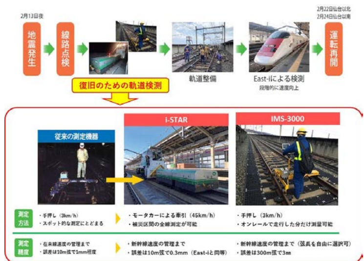
図2 復旧のための軌道検測の流れと使用機器

今回の地震発生～軌道検測・整備～運転再開までの流れと、使用した検測機器を図2に示す。具体的には新幹線軌道検測車（以下：East-i）による動的検測および速度向上を迅速に進めるため、保守用車牽引タイプの軌道検測装置（以下：i-STAR）とオンレール式測量機器（以下：IMS 3000）を併用した軌道検測を実施した。これはJR東日本が過去の震災を教訓に、災害時の早期復旧実現に向け、軌道状態を早急・高精度に把握するために整備してきた機器・体制である。