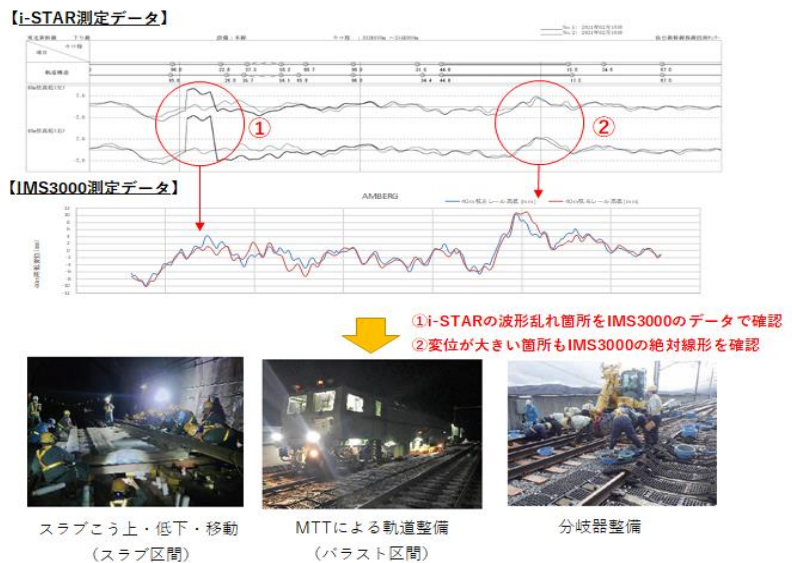
図3 軌道における復旧工事の様子

軌道状態を早期に精度良く把握できたことで、修繕計画の策定が推進され、復旧工事の早期完遂を実現。インフラ事業者として災害時の早期復旧と地域間の交通結節機能の維持という使命を果たすことができた。今後も激甚化・頻発化する災害に向けて、防災・減災の対策に取り組むとともに、安全・安定輸送に貢献していく。